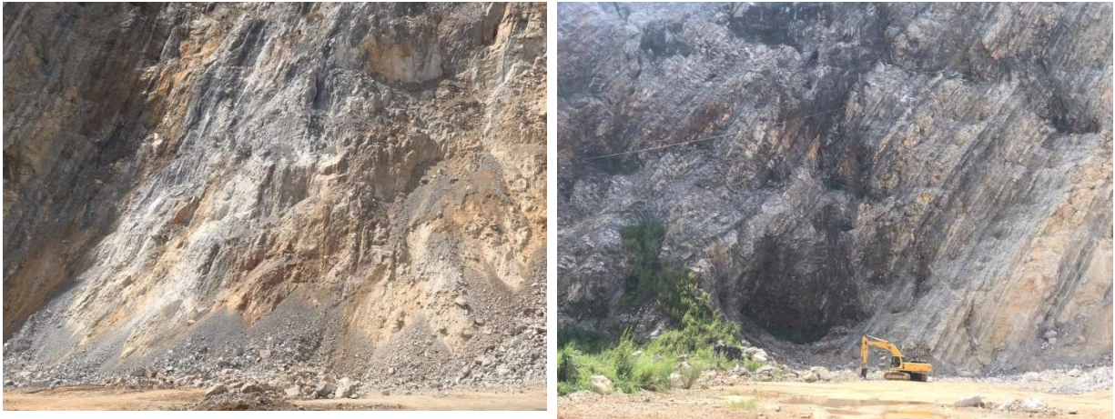
Hình 1.1: Hiện trạng khu vực khai trường của Dự án

Qua Báo cáo kết quả hoạt động khoáng sản và thống kê, kiểm kê trữ lượng của Công ty Cổ phần Đá Đồng Mỏ. Khối lượng khoáng sản đã được công ty khai thác tính đến hết ngày 30/6/2025 là: 2.315.509,50 m 3 đá thành phẩm (đã được xác định tại Biên bản quyết toán tính tiền cấp quyền khai thác khoáng sản ngày 10/02/2026 của Sở Nông nghiệp và Môi trường phối hợp với Sở Xây dựng, Sở Tài chính; Thuế tỉnh Lạng Sơn; UBND xã Chi Lăng và Công ty cổ phần đá Đồng Mỏ) tương ứng 2.778.611,41m 3 sản lượng quy đổi ra khoáng sản nguyên khai hay 1.883.804,34 m 3 đá nguyên khối, hệ số nở rời là 1,475.