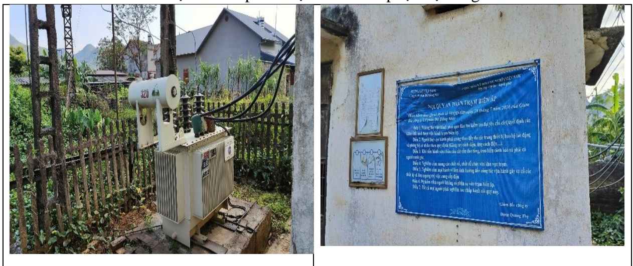
Hình 1.2: Hình ảnh trạm biến áp phục vụ sản xuất của mỏ

Cơ sở bố trí 02 trạm biến áp khu vực khai thác phục vụ công tác chế biến: